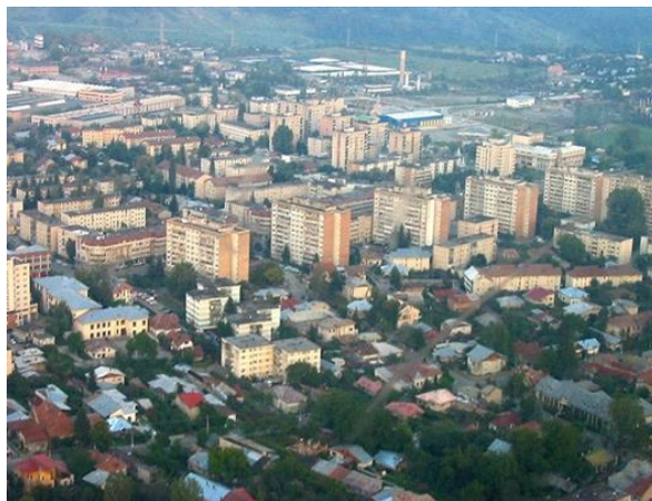
Fig. 1 Orașul Câmpina

Așezat la o altitudine medie de 450m, orașul se înscrie în zona subcarpatică. Este mărginit la nord de râul Câmpinița, la est de râul Doftana, iar la vest de râul Prahova. Cele trei râuri au reușit să modeleze terasa Câmpinei, transformând-o într-o platformă triunghiulară, cu pante mai line ori mai abrupte, care se întinde pe o suprafață de 2.423 hectare, având o ușoară înclinare pe direcția nord-sud. Terasa Câmpinei este mărginită de o serie de dealuri, care au transformat-o într-o depresiune ferită de vânturile puternice ce bat în câmpie.