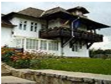
Fig.4 Muzeul Nicolae Grigorescu

Muzeul „Nicolae Grigorescu”, amenajat în fosta locuință a pictorului Nicolae Grigorescu. În anul 1939, Gheorghe Grigorescu, singurul moștenitor al lui Nicolae Grigorescu, a vândut Primăriei Câmpina 202 de tablouri și schițe în peniță, creion și laviu, semnate de pictorul Nicolae Grigorescu. În prezent, acestea se află în posesia Primăriei Municipiului Campina, urmând a fi expuse în cadrul unei colecții publice;