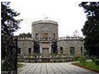
Fig.3 Castelul Iulia Hașdeu

Castelul „Iulia Hașdeu”, creația lui Bogdan Petriceicu Hașdeu, construit în memoria fiicei sale, Iulia Hașdeu, după moartea acesteia (numit și „Castelul Magului de la Câmpina”), care, alături de cavoul Iuliei Hașdeu din Cimitirul Bellu din București, reprezintă una dintre construcțiile unicat realizate, aproape exclusiv, pe baza informațiilor și planurilor transmise de către Iulia (din „lumea de dincolo”), în cadrul ședințelor de spiritism organizate de tatăl său.