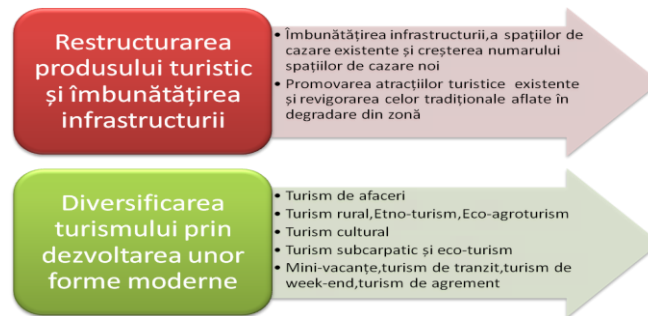
Fig.5 Direcții strategice de dezvoltare a turismului în zona Câmpinei

Direcțiile strategice de dezvoltare a turismului în zona Câmpinei sunt: Restructurarea produsului turistic și îmbunătățirea infrastructurii - cazare, masă, transport, agrement; Strategia de diversificare în turismul din ZONA CÂMPINA prin dezvoltarea unor forme moderne de turism.